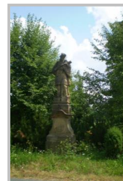
Foto : sv.Jan Nepomucký

Předpokládané zdroje financování : MMR, MK, Strukturální fondy EU, OK, vlastní