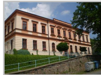
Foto : Základní škola