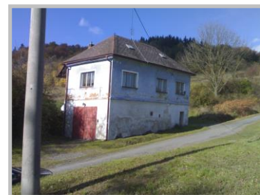
Foto : hasičská zbrojnice

Obecní úřad - vytvoření manipulačního dvora s možností ukládání tříděných odpadů před svozem likvidační firmou.