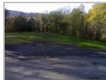
Foto : místo pro parkoviště

Předpokládané zdroje financování : Strukturální fondy EU,POV, vlastní