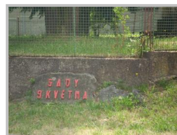
Foto : sady 9.května

Návrh :- zpracování projektové dokumentace na řešení všech požadavků úpravy veřejného prostranství s návrhem:úprav komunikace, osazení zeleně a obecního mobiliáře( vývěsky, koše,lavičky) - zpracování restaurátorského záměru památníku osvobození - vlastní realizace díla ve dvou projektech: kompletní úprava veřejného prostranství a restaurování památníku osvobození odbornými firmami