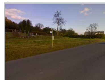
Foto : autobusová zastávka

Předpokládané zdroje financování : POV, vlastní