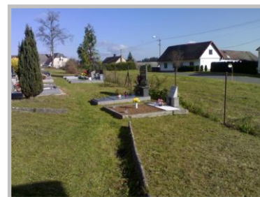
plot na místním hřbitově

Předpokládané zdroje financování : Strukturální fondy EU,OK, SFŽP, OK, MMR, vlastní