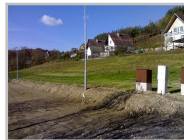
Foto : výstavba

Předpokládané zdroje financování : Strukturální fondy EU,POV, vlastní