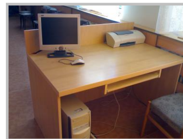
Foto : technika v knihovně

Předpokládané zdroje financování : MMR, OK, vlastní